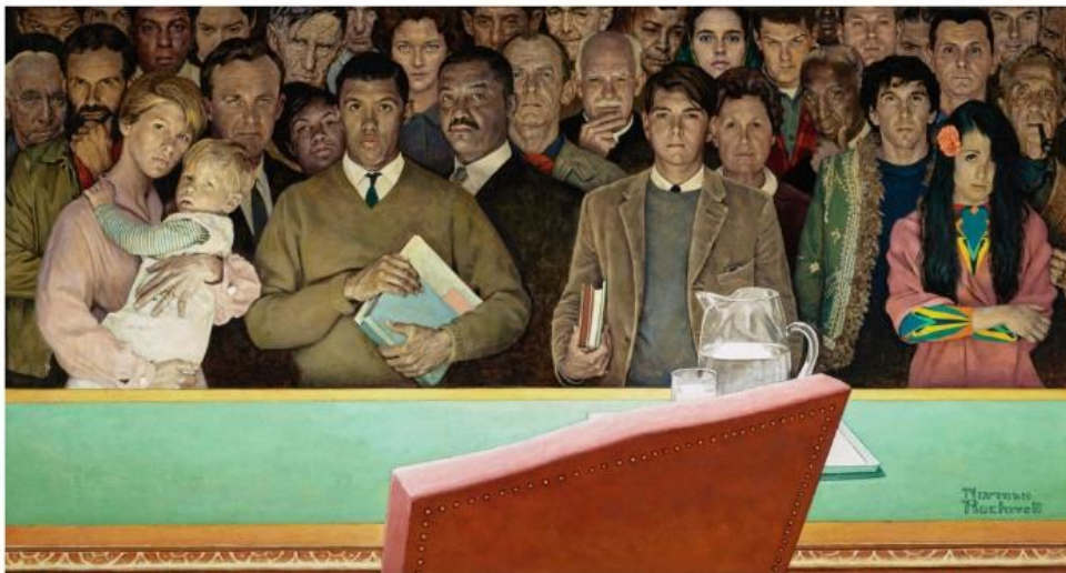
NORMAN ROCKWELL MUSEUM

Ispirato al "Diritto di sapere" (1968) di Norman Rockwell, questo murale è stato realizzato su una parete pubblica, in una scuola, per una ragione precisa.