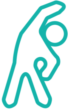
ACTIVIDAD DE CALENTAMIENTO